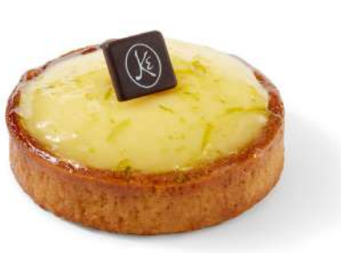
TARTE AU CITRON