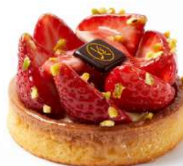
TARTE AUX FRAISES