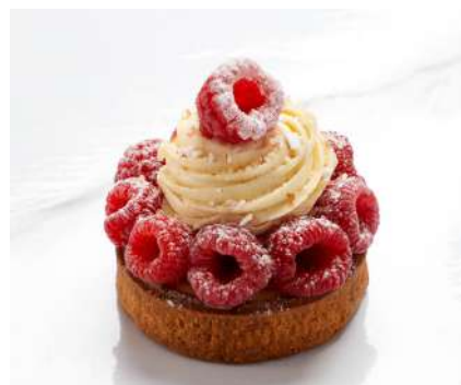
TARTELETTE FRAMBOISE NOUGAT