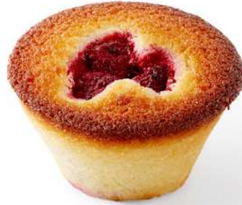
FINANCIER AUX FRAMBOISES