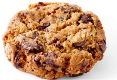
COOKIE CHOCOLAT NOIR NOIX DE PÉCAN