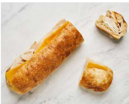
SANDWICH POULET CHEDDAR