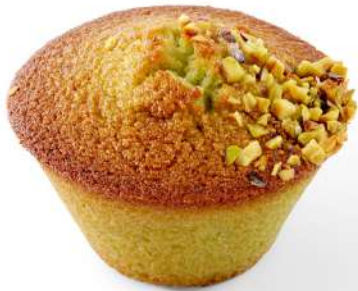
FINANCIER AUX FRAMBOISES