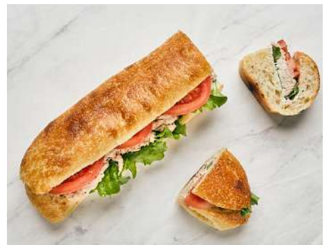
SANDWICH AU THON