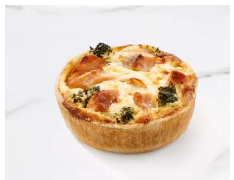
QUICHE SAUMON BROCOLIS