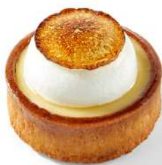
TARTE YUZU MERINGUÉE