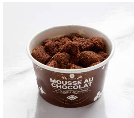
MOUSSE AU CHOCOLAT