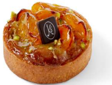
TARTE ABRICOT PISTACHE