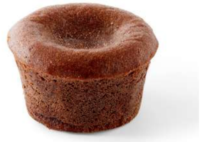
MI CUIT CHOCOLAT