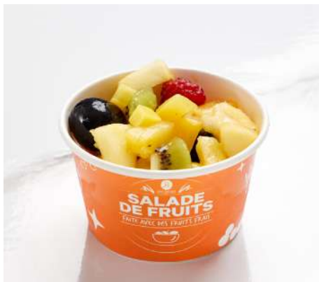
SALADE DE FRUITS

Apple and strawberry compote with oat crumble.