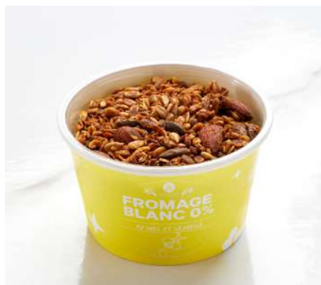
FROMAGE BLANC, MIEL, GRANOLA GOURMAND