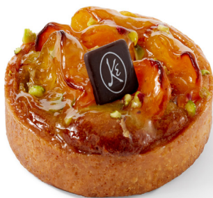
TARTE ABRICOT PISTACHE