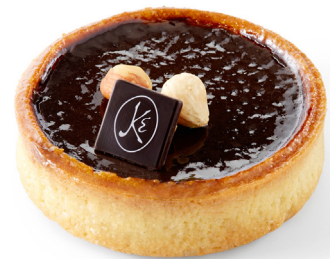
TARTE CHOCOLAT NOISETTE