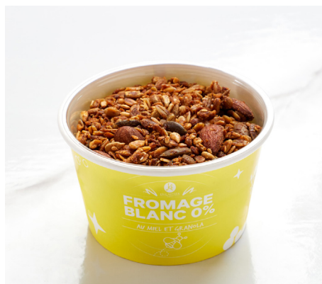
FROMAGE BLANC, MIEL, GRANOLA GOURMAND