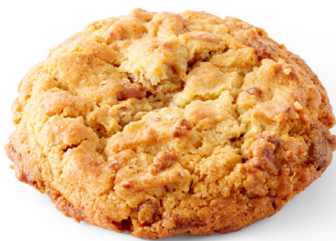
COOKIE CHOCOLAT BLANC ET NOIX DE MACADAMIA