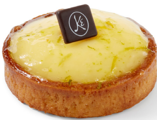
TARTE AU CITRON