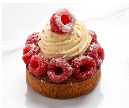
TARTELETTE FRAMBOISE NOUGAT