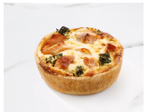
QUICHE SAUMON BROCOLIS