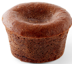
MI CUIT CHOCOLAT