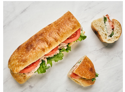
SANDWICH AU THON