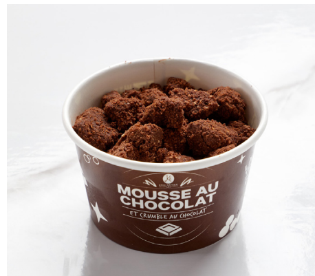
MOUSSE AU CHOCOLAT