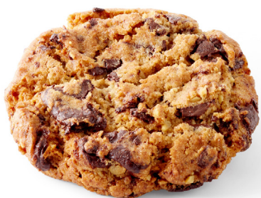
COOKIE CHOCOLAT NOIR NOIX DE PÉCAN