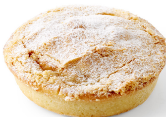
CRUMBLE AUX POMMES