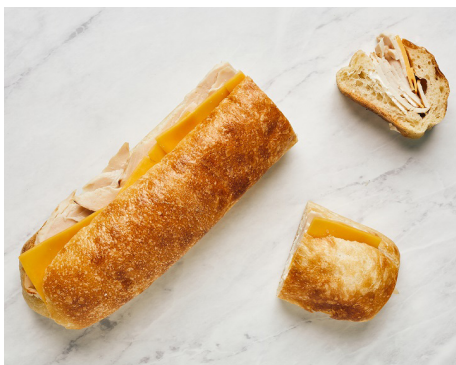
SANDWICH POULET CHEDDAR