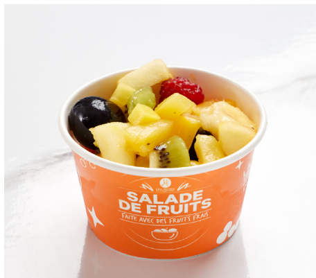
SALADE DE FRUITS

Apple and strawberry compote with oat crumble.